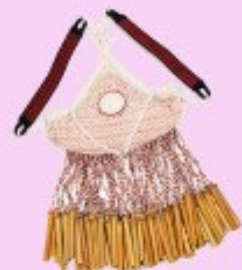
◀ 風順恩老師的3件作品