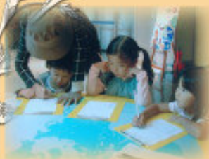
▲ 2007年日本大阪，小學生正在寫田野調查表