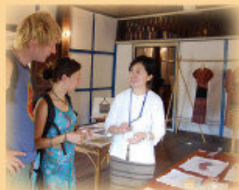
▲ 2006年寮國展覽作品及導覽說明